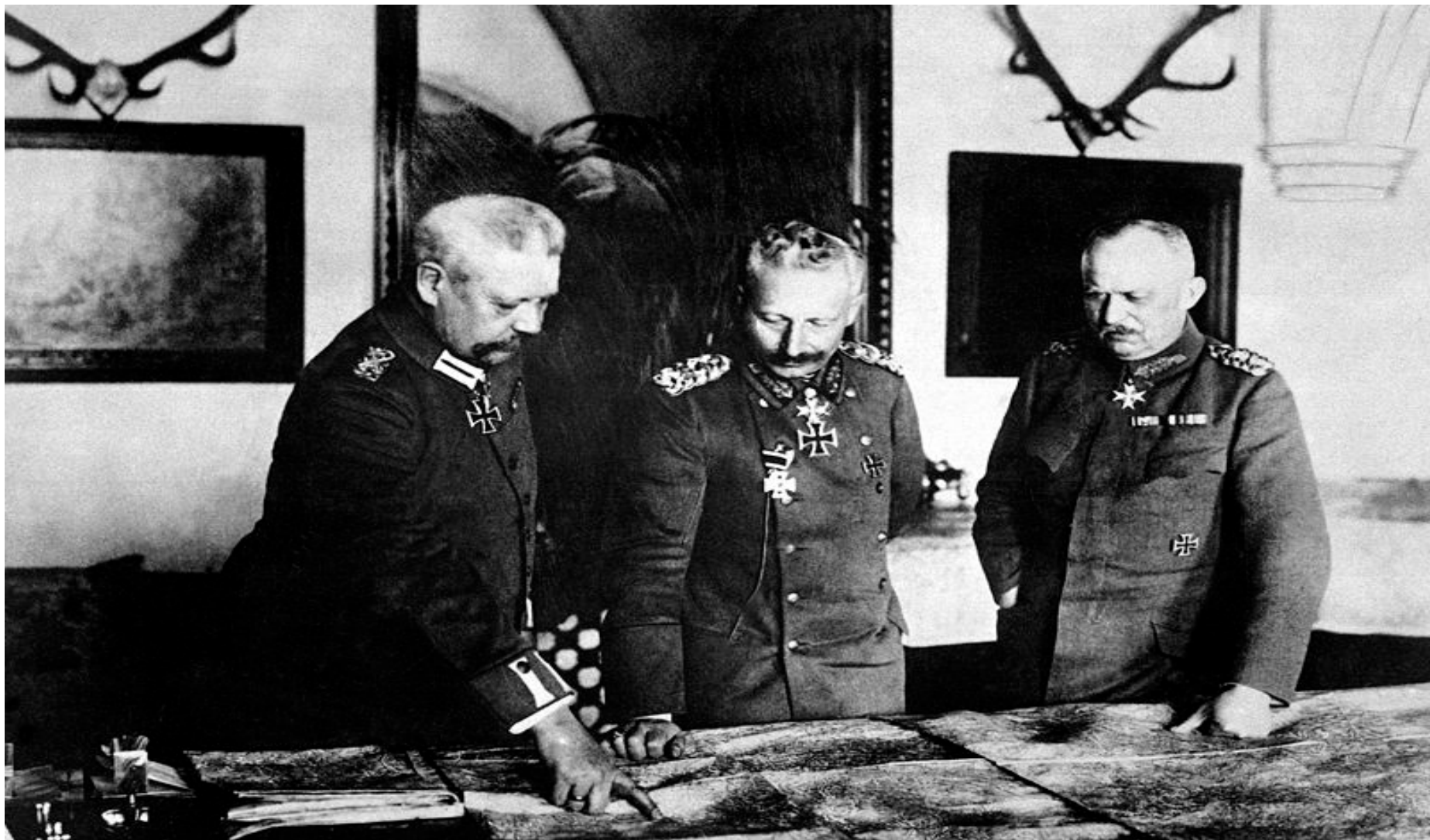
Hindenburg (links), Wilhelm II. und Ludendorff (rechts) im Jahre 1917