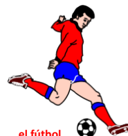
el fútbol el futbolista