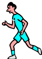
la carrera de 5 km, de 10 km, de maratón el corredor

?Puedes mencionar a nuestros deportistas famosos?