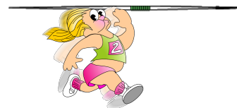
el lanzamiento de la jabalina la lanzadora de jabalina el lanzador de jabalina