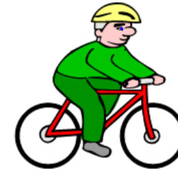
montar en bici