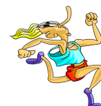
la carrera de 800 metros la corredora