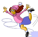
el panaje arscó la panadora arscá