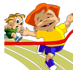
el decatión el decatleta