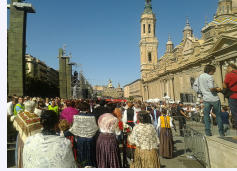
Fiestas del Pilar